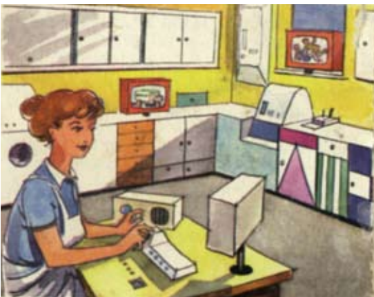
Abbildung 0.4: In der vollautomatischen Küche kann sich die Hausfrau als Herrin über die Maschinen fühlen.