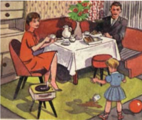
Abbildung 0.1: Die Kunststoff-Wohnung: Es ist gar nicht so schlimm, in der Kunststoff-Wohnung die Tapete zu bemalen ... Man reißt die Bahn einfach ab. Alles, was in der Wohnung steht, ist aus Kunststoff, auch die Blumen.

Lange betrachtete ich diese Bilder aus dem vergangenen Reich Technotopia, dem Königreich meiner Kindheit. Sie hatten sich auf seltsame Weise verändert. Ich hatte sie geradezu panoramisch im Gedächtnis; groß und bunt und lebensecht. Jetzt wirkten sie wie Karikaturen, wie rührende Witzbilder. Sie waren seltsam geschrumpft, auf banale Briefmarkengröße; und ihr Verblassen lag nicht nur an der Altersschwäche der Pigmente.