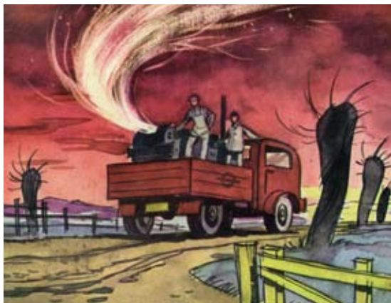
Abbildung 0.5: Die Kontrolle des Wetters: Uralt ist der Traum der Menschen, Wetter nach den eigenen Wünschen zu machen. Heute ist es möglich – Farmer schießen vom LKW aus mit einem Wetter-Generator Gefrierkerne in Form von Silberjodid in die Wolken.