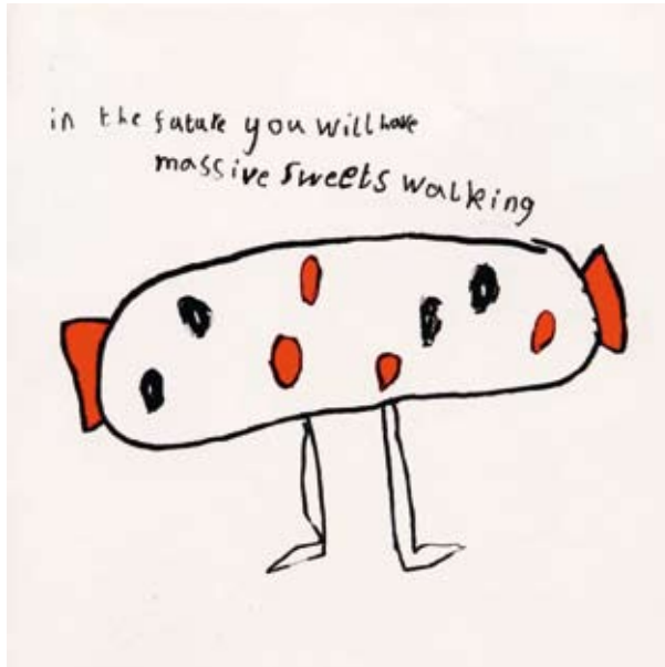
Abbildung 07: In the future you will have massive sweets walking. (In der Zukunft werden gewaltige Bonbons herumlaufen.)