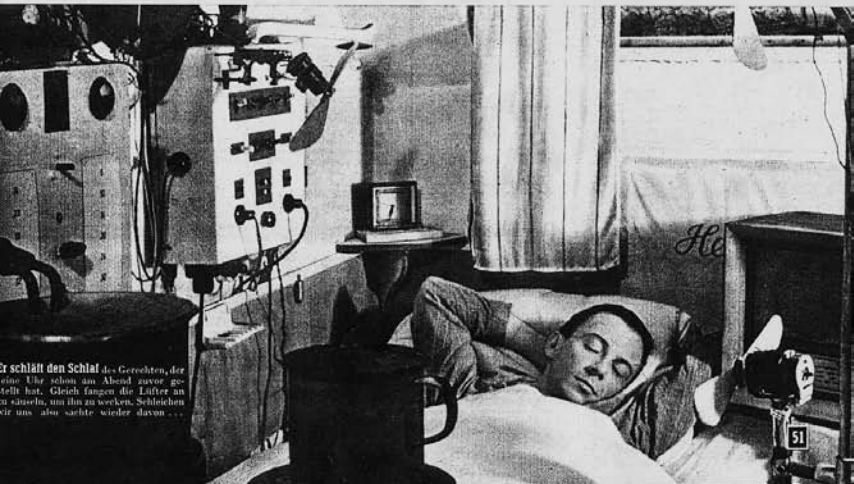
Er schläft den Schlaf des Gerechten, der eine Uhr schon am Abend zuvor gestellt hat. Gleich fangen die Lüfter an zu röhren, um ihn zu bewachen. Schließen sie uns auch solche wieder davon.