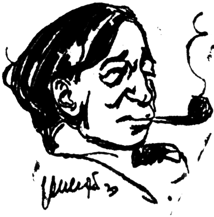
Abb. 1: Karikatur Siegfried Kracauers, in: Film-Kurier , 13.12.1930.

Am 12. Dezember 1930 erschien im Beiblatt des Berliner Film-Kuriers als sechster Beitrag in der Folge »Kritik ist schöpferische Kunst« ein Portrait des einflussreichsten Filmkritikers der Republik. 1